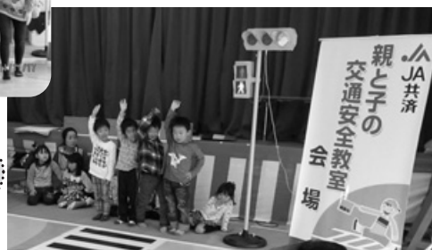
とても楽しく交通安全が 分かりやすく 身についたと思います (32歳・母親)