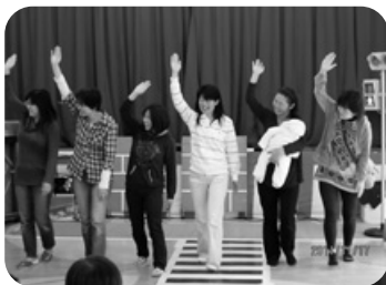
猫のポチが親しみやすく 楽しく学べました。 (29歳・母親)