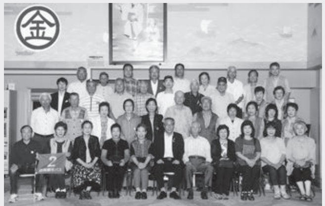
JA南すおう億友会 御一行様 於 ことりら温泉 琴参閣 平成26年7月3日