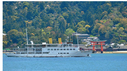
(船上から見る厳島神社)

開放感のある2階メインレストランはクルーズにぴったりの場所。料理を食べながらごゆっくり。