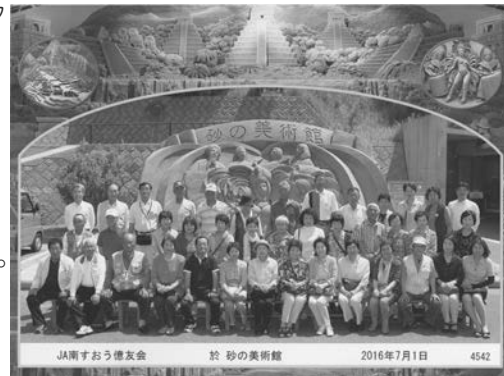
JA南すおう億友会 於 砂の美術館 2016年7月1日 4542

「とっとり花回廊」で美しい花や植物を堪能した後、皆生温泉で楽しく過ごしていただき、翌日は鳥取砂丘の「砂の美術館」で砂の彫刻を見学しました。来年度もご参加をお待ちしております。(参加者115名)