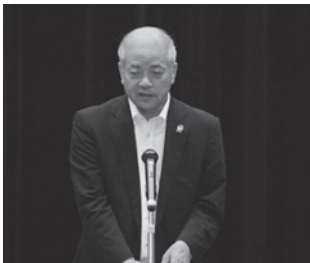
主催者挨拶 河村組合長