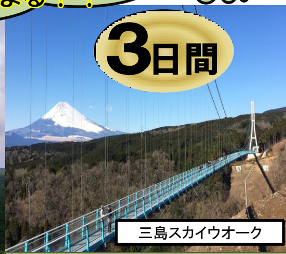
三島スカイウォーク