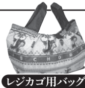
レジカゴ用バッグ